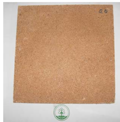
b. Papan partikel bertekstur halus b. Particleboard with smooth/fine texture