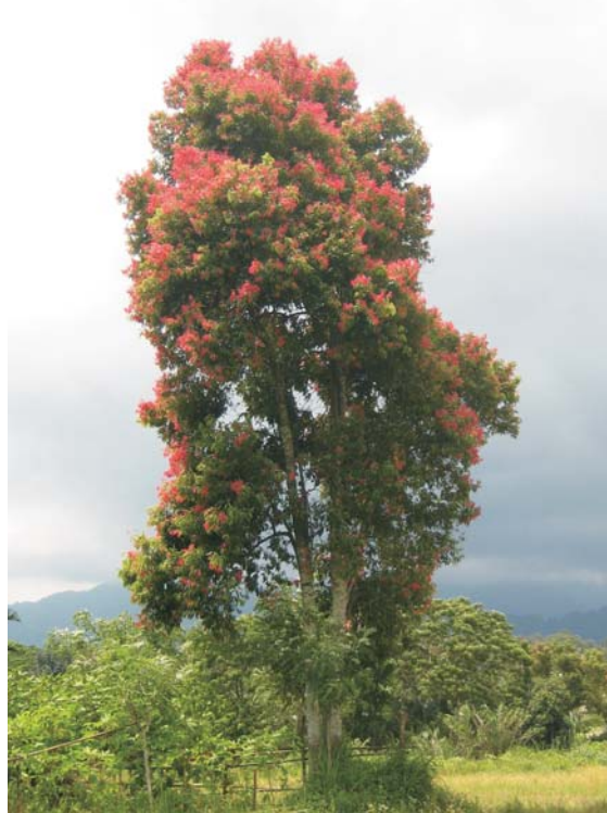
Gambar 1. Tegakan kayu kulit di Jawa Barat Figure 1. Kayu manis wood trees in West Java

Oleh karena itu untuk meningkatkan manfaat dan kegunaan kayu sisa panen dilakukan penelitian pembuatan papan partikel dari limbah penggergajian dan penyerutan kayu berupa serbuk dan serpih. Limbah yang dihasilkan dari proses penggergajian kayu manis adalah sebesar 40% berupa serbuk gergaji dan 20% berupa serpih hasil dari proses penyerutan (Abdurachman et al. , 2009). Limbah tersebut cukup berprospek dan berpotensi dimanfaatkan sebagai bahan baku pembuatan papan partikel yang selama ini memanfaatkan limbah industri kayu lapis dan kayu gergajian dari jenis kayu seperti karet dan meranti.