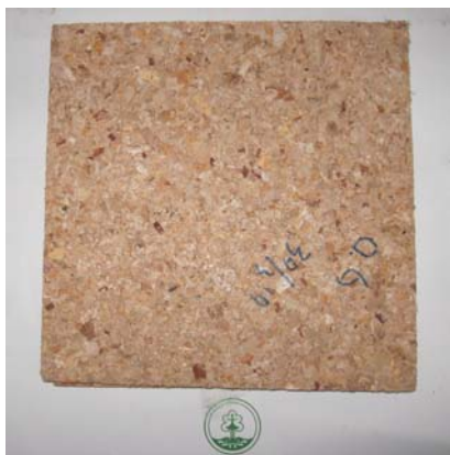
a. Papan partikel bertekstur kasar a. Particleboard with rough/coarse texture

Permukaan papan partikel kasar dan halus yang dibuat diperlihatkan pada Gambar 2.